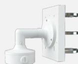
TD-YXH0101B+ TD-YZJ0406+ TD-YZJ0501