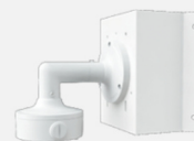
TD-YXH0101B+ TD-YZJ0406+ TD-YZJ0601